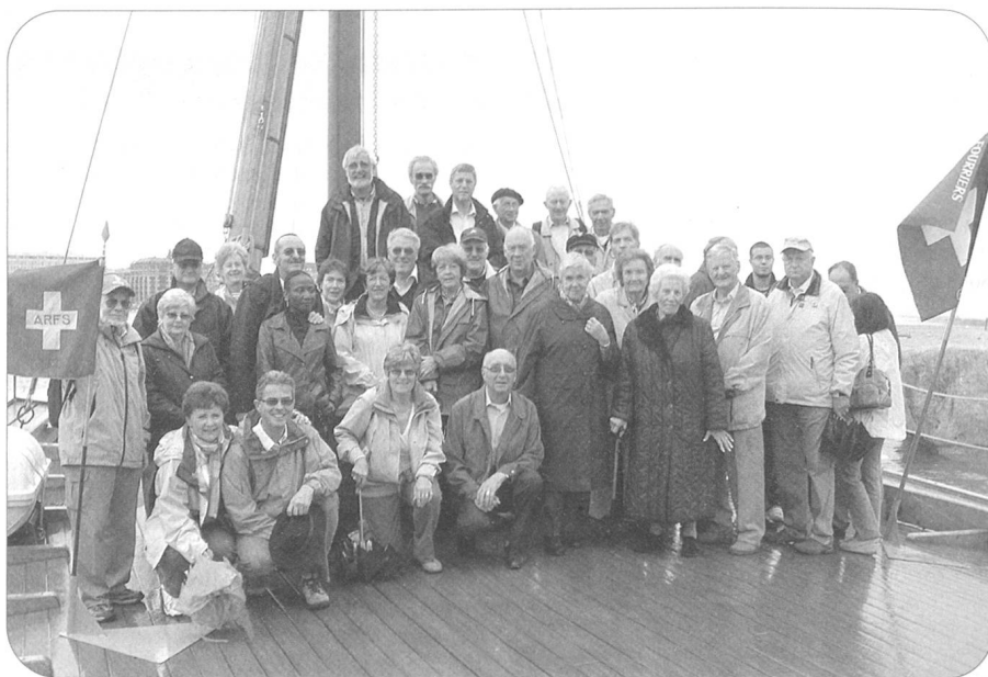
Les fourriers genevois se muent en marins d'eau douce.

08.09. 18.30 «Landhaus» Stamm 06.10. 18.30 «Landhaus» Stamm