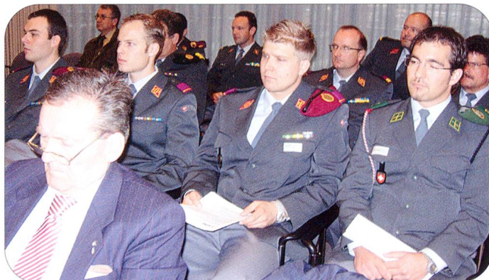
Die 12. Mitgliederversammlung der SOLOG ging reibungslos über die Bühne und voller Zuversicht sieht man der Kommenden entgegen.