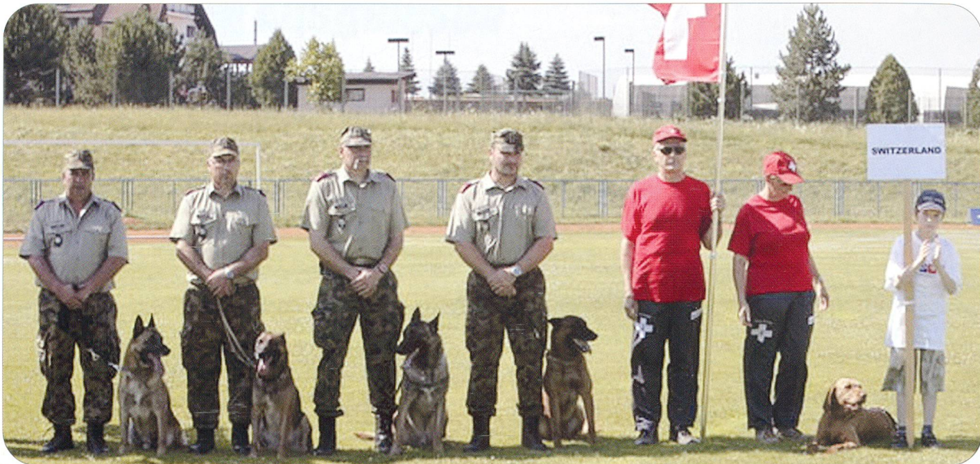
Im kroatischen Samobor kämpfte diese Schweizer Delegation um den Weltmeistertitel.