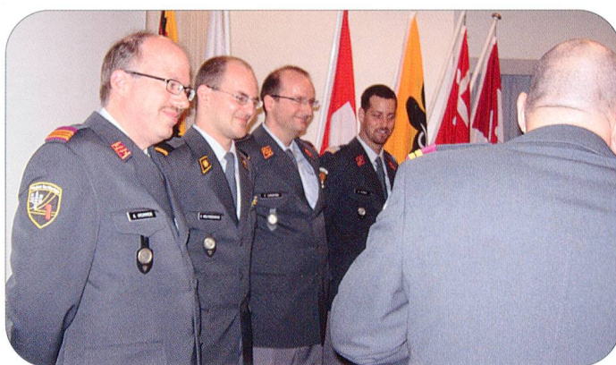
Auch den vier Sektionspräsidenten wurde für die grosse Arbeit während des ganzen Jahres ein Präsent überreicht.