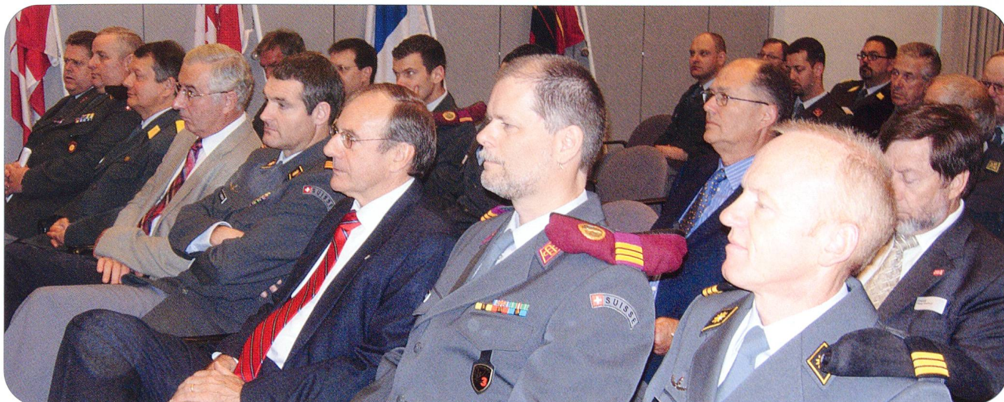
Aufmerksam folgten die Teilnehmer den Ausführungen von Nationalrat Pius Segmüller.

...dass ARMEE-LOGISTIK mit dem versprochenen zusätzlichen Bilderbogen die 12. Mitgliederversammlung der SOLOG in der Leuchtenstadt Luzern nochmals in Erinnerungen ruft. In der nächsten Ausgabe von ARMEE-LOGISTIK folgt der Beitrag der 90. Jubiläums-Delegiertenversammlung des Schweizerischen Fourierverbandes in der herrlichen Ambassadenstadt Solothurn. (-r.)