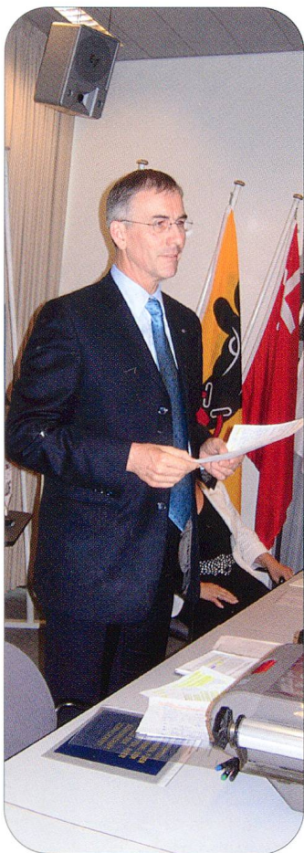
Nationalrat Pius Segmüller.