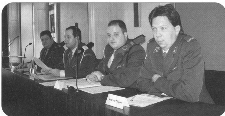
Blick gegen den Vorstandstisch, wo sonst das Kantonsparlament tagt.

Wenn die Hellgrünen jeweils in Zug tagen, scheint sich die ganze Bevölkerung zu freuen. So auch, als die Sektion Zentralschweiz am 15. März die 89. Generalversammlung abhielt.