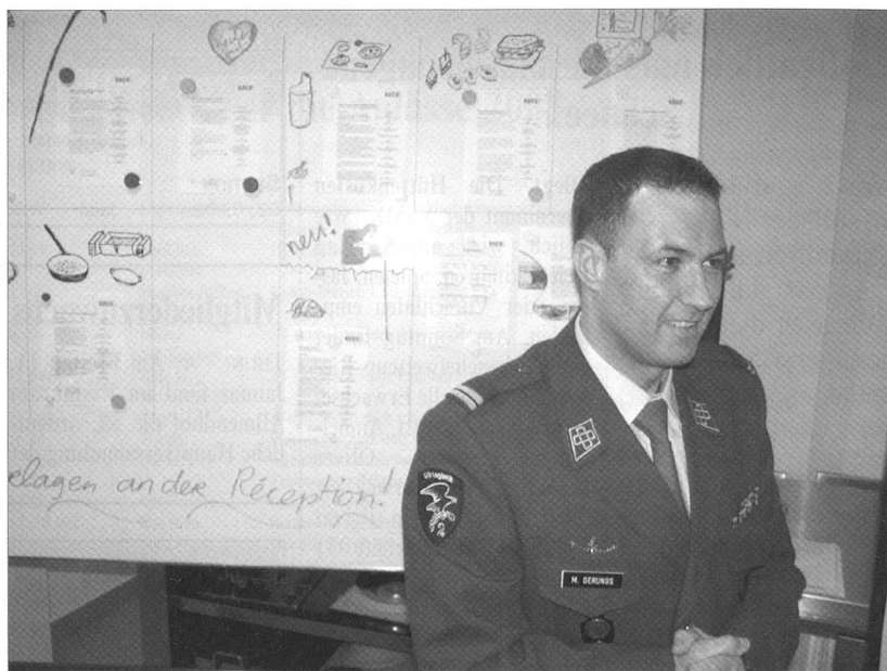
Am vorletzten November holte sich die Nationalmannschaft der Schweizer Militärköche den verdienten Weltmeistertitel. Am letzten Dezember tagte das SACT-Team zusammen mit den Sponsoren zum alljährlichen Debriefing in Gümligen. Mehr darüber auf Seite 24 in dieser Ausgabe von ARMEE-LOGISTIK.

Die Resolution 1244 des UNO-Sicherheitsrates vom 10. Juni 1999 bleibt ohne gegenteiligen Beschluss des UNO-Sicherheitsrats auch nach einer möglichen