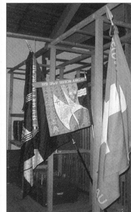
Ein würdiger Platz für die Feldzeichen wurde gefunden.

Wahrlich, einen besseren Spruch zur Auflösung der beiden Sektionen gibt es nicht!