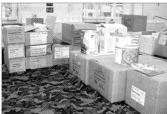
Im Jahr 2008 gibts auch verschiedene Änderungen im Angebot des Armeeprovianten.

Lesen Sie bitte weiter auf den Seiten 4 bis 6