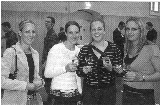
Während des ganzen Abends herrschte eine gelöste Stimmung.