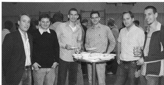
Allmählich wird der Ehemaligentag zur beliebten Tradition.

SCHAFFHAUSEN. – r. Die Kantonale Offiziersgesellschaft Schaffhausen ist in Festlaune. Dieses Jahr kann sie nämlich das 200-jährige Bestehen feiern. Ein Grund genug, um kurz innezuhalten und einen Blick zurück in die Vergangenheit, in die Gegenwart und ebenso in die Zukunft zu werfen. Dazu erstellte ein hochkarätiges Autorenteam eine 60-seitige farbig gestaltete Broschüre. Auch verschiedene Persönlichkeiten werden darin vorgestellt: Von den Präsidenten der KOG Schaffhausen von 1807 bis 2007. Stolz präsentieren sich ebenfalls die Schaffhauser Ein-, Zwei- und Drei-Sterne-Generäle. Nicht vorenthalten werden den Lesern markante Ereignisse in der Präsidialzeit einiger KOG-Präsidenten. Kurzum: Süfflig-leicht zum Lesen, grosszügige Gestaltung und natürlich mit abwechslungsreichen Themenwahl. Kurzum: Ein militärischer Beitrag.