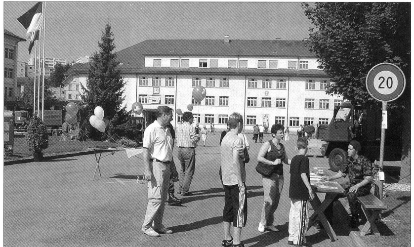
Im Zentrum vieler Leute an der 850-Jahre-Feier von Freiburg stand auch der Tag der offenen Tür der Nach- und Rückschub-Schule 45.

Entgegen bisherigen Hoffnungen ist nach wie vor nicht entschieden, ob das neue Soldatenmesser international ausgeschrieben werden muss oder nicht. Die armasuisse gibt lediglich an, dass die Ausschreibung «nicht unbedingt» international erfolgen muss. Die Schweiz habe jedoch das internationale Beschaffungsabkommen GPA unterzeichnet, an das man sich halten müsse.