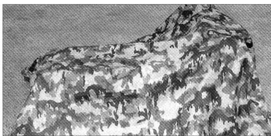
Unter dieser Zeltblache steckt ein Gegenstand, der einen andern ablöst, der während rund 60 Jahren fast täglich zum Einsatz kam und nicht mehr gebraucht wird. Was wird wohl sein? Mehr darüber in der nächsten Ausgabe von ARMEE-LOGISTIK.