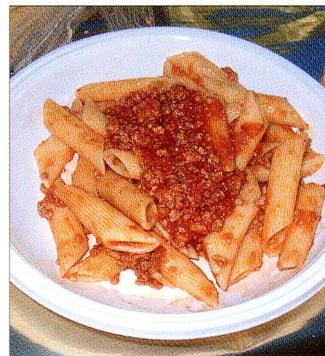
Während des Marsches wurden die Teilnehmer natürlich mit Pasta verwöhnt – ein Gedicht!