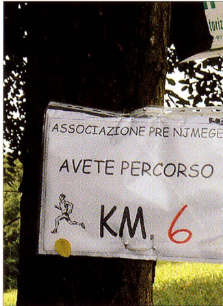
6 km sind bereits geschafft.