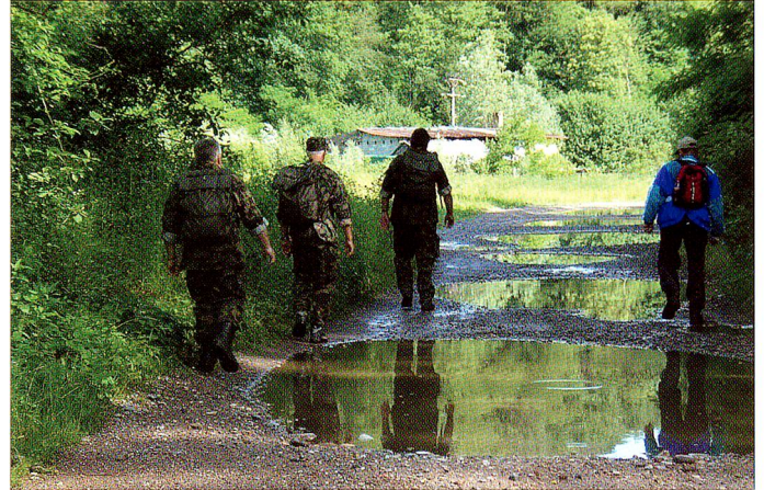
Zahlreiche Pfützen müssen umgangen werden. Holland lässt grüssen...