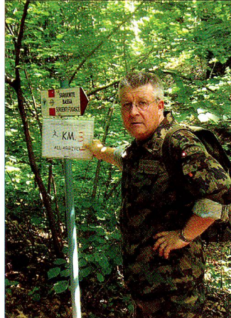
Das Ziel in Malnate naht.