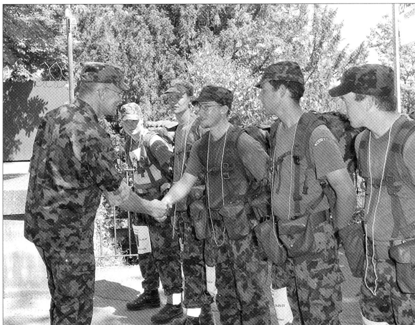
Den Gratulationswünschen zum Bestehen des 100-Kilometer-Marsches von Luzern nach Bern schliessen wir uns gerne dem Chef der Armee, Korpskommandant Christophe Keckeis an.