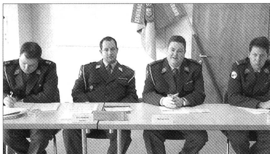
Stets aktiv und ebenfalls innovativ ist der Vorstand der Sektion Zentralschweiz des Schweizerischen Fourierverbandes.