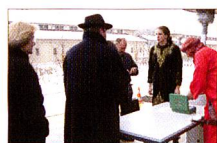
Einen grossen, vielschichtigen und bunten Interessenkreis zogen während der Museumsnacht die verschiedenen Angebote rund um «1001 Nacht» der Eidgenössischen Militärbibliothek an, die in der Nacht vom 23. März ganz Bern verzauberte.