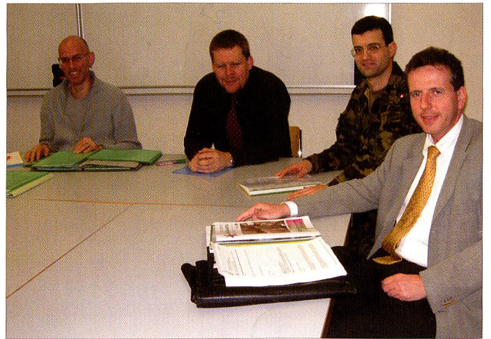
In Bern tagte der Zentralvorstand des Verbandes Schweizerischer Militärkitchenchefs (VSMK) zur 14. erweiterten ZV-Sitzung (Bilder links). Ebenfalls der ZV des Schweizerischen Fourierverbandes bereitete in der Kaserne Aarau die kommende Delegiertenversammlung vor; jedoch im Gegensatz zum VSMK in einer eher trockenen Umgebung.