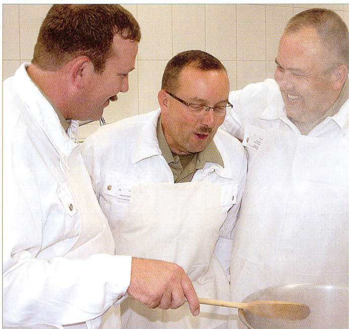
Ende gut – alles gut. Sogar Generäle können sich ob einer gelungenen Kochkunst so richtig erfreuen.