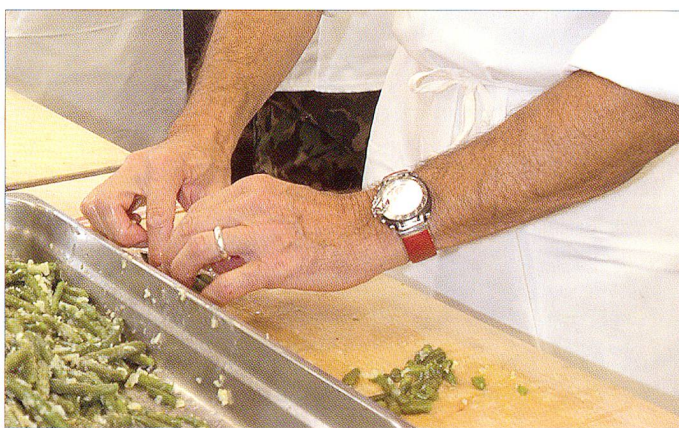
Nicht ungeschickt, die Hände von zwei Generälen unserer Armee beim Zubereiten von Speisen.