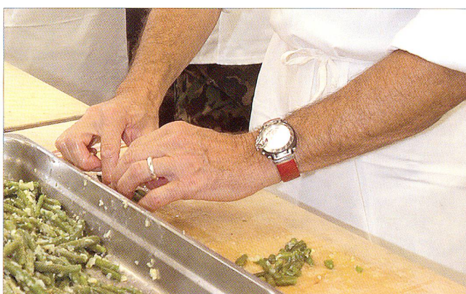
Nicht ungeschickt, die Hände von zwei Generälen unserer Armee beim Zubereiten von Speisen.