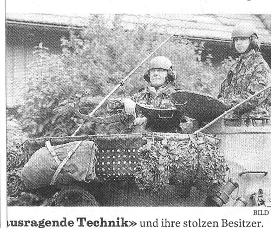
ausragende Technik» und ihre stolzen Besitzer.