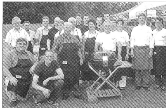
... und zu guter Letzt noch das obligate Gruppenbild.

Nach dem Frühstück führt uns die letzte Etappe wiederum mit der von Poschiavo über den Bernina-Pass nach Pontresina. Dort erwarten uns die Fahrer des AMMV, welche uns über den letzten Pass, dem Julier, zum Marmorerasee fahren. Gestärkt nach dem Mittagessen verlassen wir langsam den Gastkanton Graubünden und fahren zurück nach Aarau.