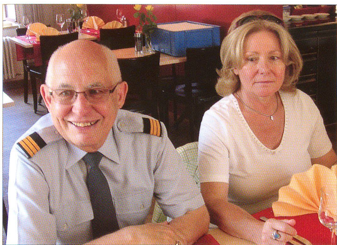
Nach «getaner Arbeit» kommt auch das vergnügliche Beisammensein mit Partnerin nicht zu kurz.