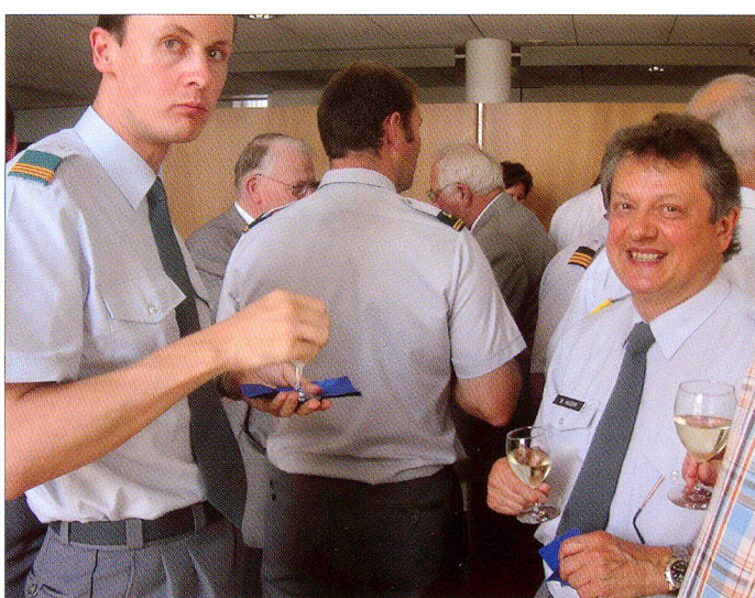
Erfolgreich und mit viel Schwung in die Zukunft beendete die SOLOG ihre zehnte Mitgliederversammlung – natürlich immer unter dem Credo: «Der Tradition verbunden, für den Wandel der Zeit offen, aber immer der Gemeinschaft verpflichtet.»