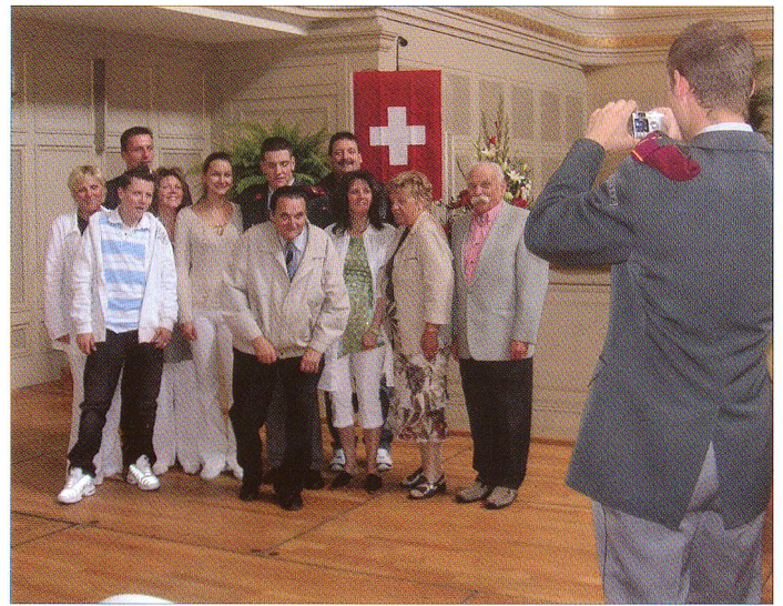
Nun keine Hemmungen – jetzt fotografiert ein frischgebackener Logistik-Offizier einmal seine Liebsten ... und nicht umgekehrt.