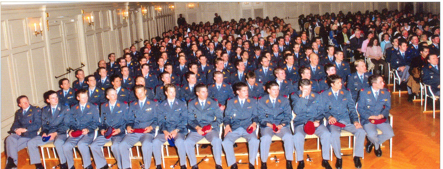
Der Höhepunkt ist wohl jeweils die Beförderung zum Offizier der Schweizer Armee.