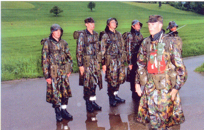
In bester Erinnerung bleibt zweifellos der 100-Kilometer-Marsch vom Löwendenkmal Luzern direkt in die Kaserne Bern.