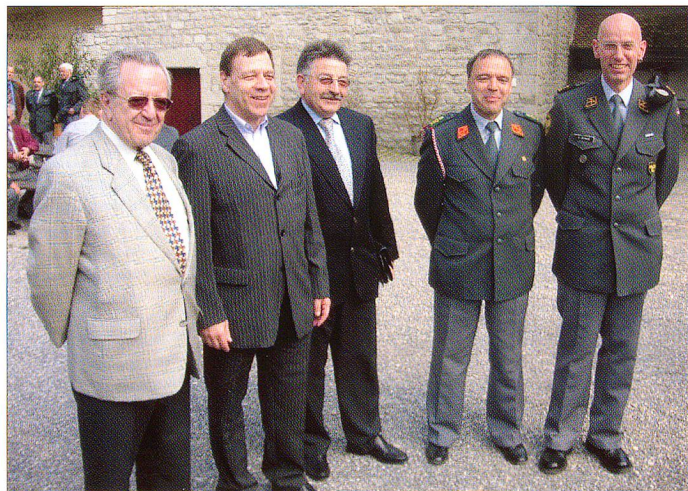
Der amtierende sowie ehemalige Zentralpräsidenten des SFV.