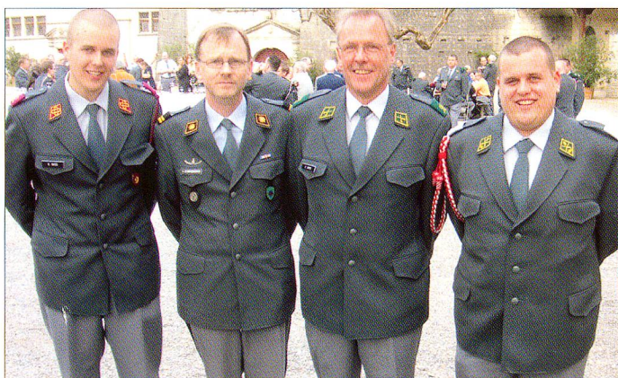
Der Präsident des Verbandes Schweizer Militärküchenchefs ist stolz auf seine beiden Söhne (rechts und links), die in seine Fussstapfen als Küchenchef traten. Zum Gruppenbild gesellte sich auch der Kommandant des Lehrganges für Küchenchefs (2. von links).