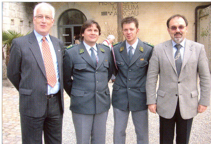
Die Delegation der Sektion Tessin des SFV genoss offensichtlich den gemütlichen Tag auf dem Schloss Lenzburg.