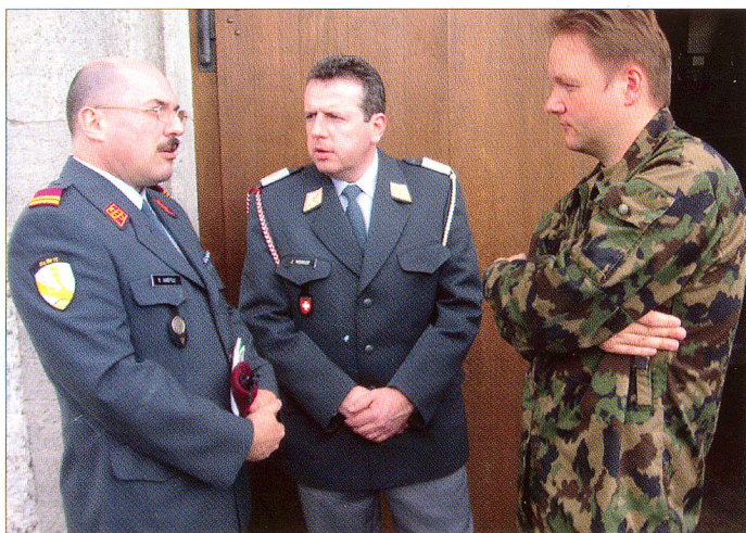
Auch in «gemischten Kreisen» lässt sich gut diskutieren.