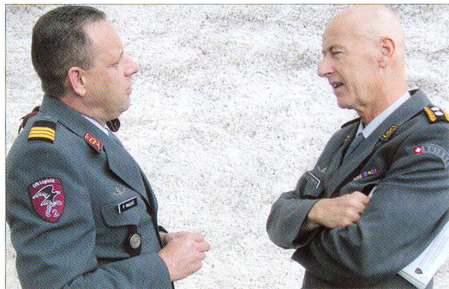
Noch bevor die Servicefrau von der «Krone», Lenzburg, den vom Kanton Aargau gespendeten Dessert servieren konnte (Bild Mitte), genossen die Teilnehmer entweder die schöne Aussicht, andere hingegen liessen sich für ein persönliches Gespräch hinreissen.