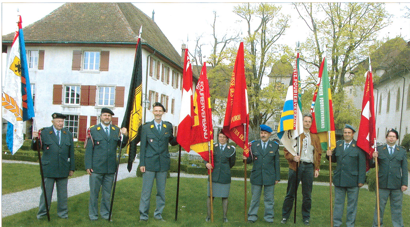
Einige der Banner der Sektionen des Schweizerischen Fourierverbandes (SFV) zum Gruppenbild im Hof des Schlosses Lenzburg.