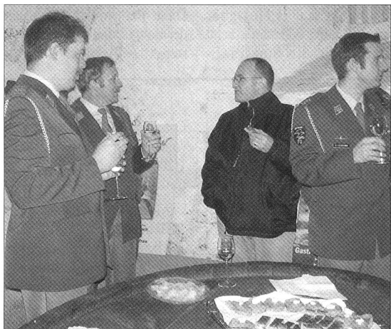
Vor dem Hauptgang «Suure Mocke» kredenzteten die Teilnehmer der Hauptversammlung einen feinen Tropfen und genossen die zahlreich vorhandenen Häppchen.