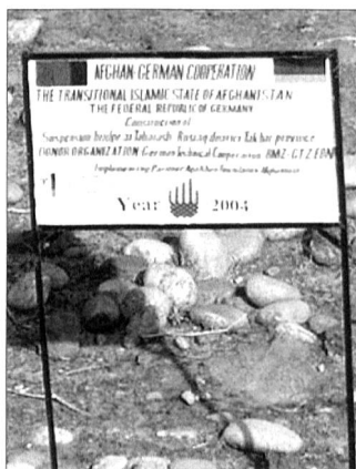
Gemeinsame Baustelle in Feyzabad.

Bis Mitte 2004 trafen 66 400 Fluggäste ein, über 5000 Tonnen Flugfracht wurden abgefertigt. An Fluggerät stehen sieben Transall C-160 und fünf mittlere Transporthub-