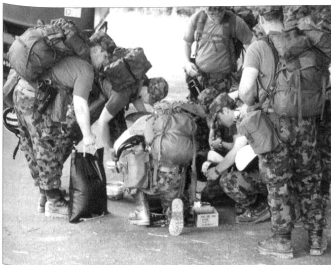
Die Schweizer Armee hat im ersten Halbjahr 2005 15 Prozent mehr Einsätze als in der Vorjahresperiode geleistet.