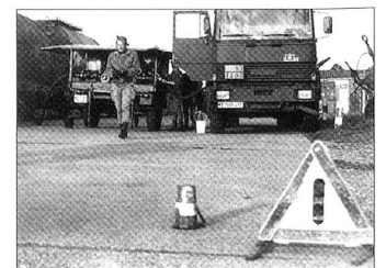
«Vorsicht!» Wie lange bleibt die Bundeswehr noch fahrbereit!

Scheinbar ist es heute üblich, «Geschäftsfreunden» lukrative Aufträge zuzuschanden, Arbeit zu verteilen und wohl vor allem Verantwortung abzuwälzen. Die Bundeswehr verfügt über Tausende Offiziere, die sich auf Kosten des Steuerzahlers auch moderne Betriebswirtschaftslehre, Volkswirtschaft oder Management-Wissen erwerben. Warum werden diese hochqualifizierten Fachleute, die sich in einigen Praktikanten-Jahren in der freien Wirtschaft auch praktische Kenntnisse aneignen könnten, nicht auf diesen Personenkreis übertragen? Umsonst studiert? Oder: «Ran an den Handkurbelwagen!»