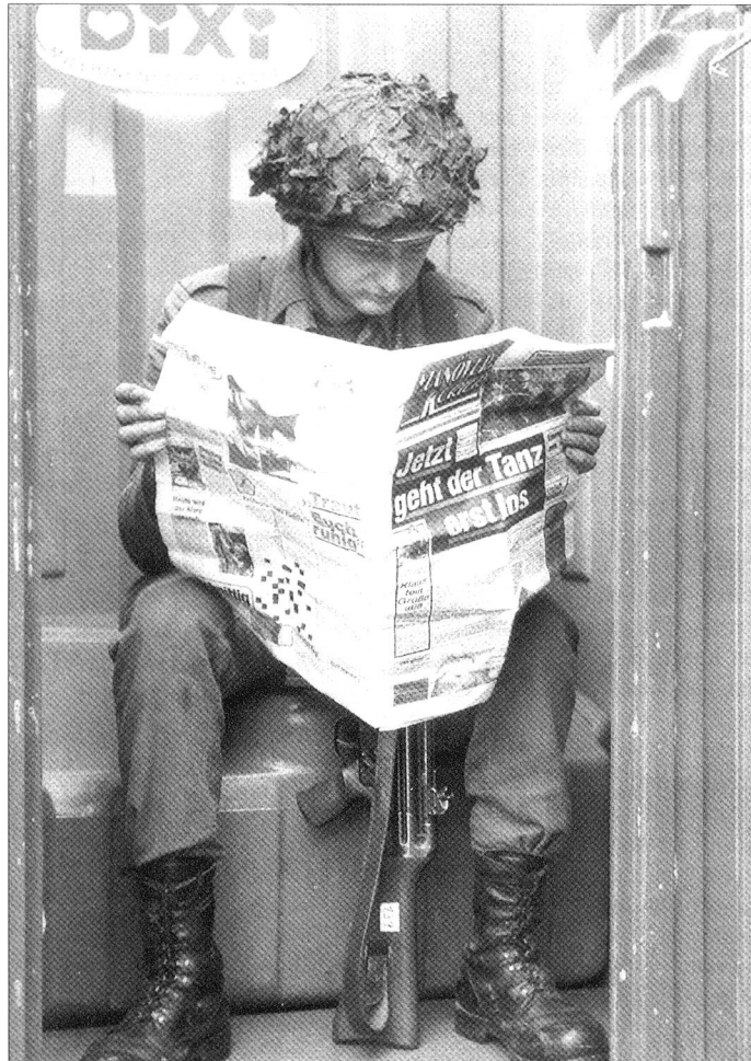
«Sitzung» (mit Waffe) auf geleaster Bundeswehr-Toilette.

Auch die Erwartungen in die Privatisierung des Fuhrparks haben sich nach einigen Anfangserfolgen nicht erfüllt. Daher sollen viele Umstrukturierungsaufgaben wieder auf die Truppe «rückübertragen» werden. Angeblich hat die Fuhrparkfirma einen zweistelligen Millionenbetrag zweckwidrig verwendet. Untersuchungen laufen. Die geplanten Einsparungen von einer Milliarde Euro in den nächsten zehn Jahre erscheinen unrealistisch.