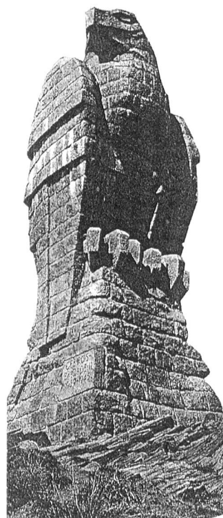
Denkmal der Gebirgsbrigade 11 auf der Simplon-Passhöhe.

Dank der Führung eines Einheimischen gelang es den Franzosen von Guttannen aus, über die Höhen des Nägelisgrätli in einer Umgehungsaktion, am 14. August 1799 auf die Grimsel und in den Rücken der österreichischen Stellung vorzustossen. Die Österreicher wurden bezwungen und zogen sich ins Goms zurück.