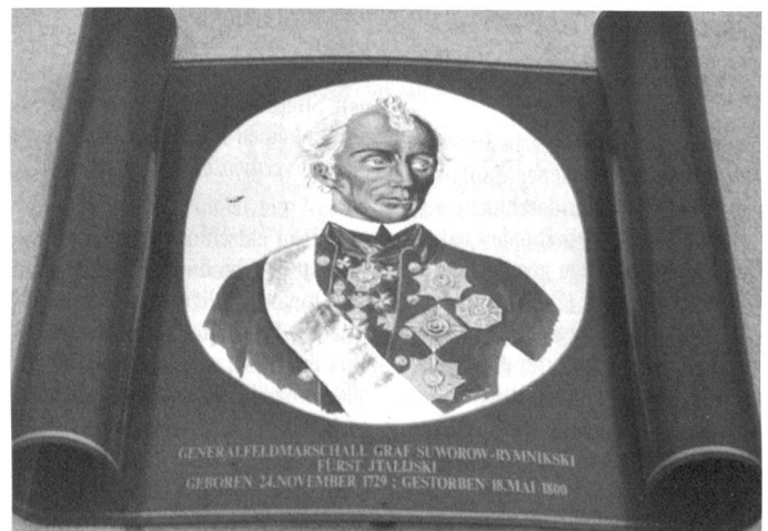
Suworow auf Wirtshausschild beim Restaurant Teufelsbrücke.

Nach dem Untergang der alten Eidgenossenschaft wurde die Schweiz zum Kriegsschauplatz der europäischen Mächte. 1799 schlugen sich mit wechselseitigem Erfolg Franzosen, Österreicher und Russen am Gotthard. In Erinnerung geblieben ist vor allem die denkwürdige Alpenüber-