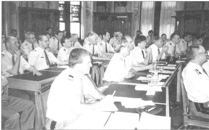
Ein Blick in die Runde der 7. Mitgliederversammlung SOLOG in Luzern.