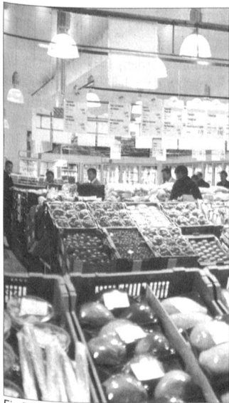
Ein Blick in den begehbaren Kühlbereich, den so genannten «Cool Way».

malen Lagerhaltungsbedingungen und die Einhaltung der Kühlkette garantiert eine einwandfreie Qualität der Produkte.