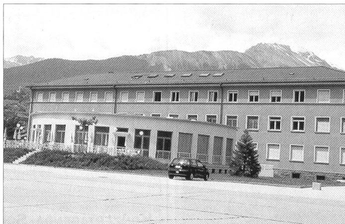
Zur Zeit wird die Offizierskaserne von Sitten auf Vordermann gebracht.