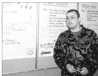
U «AUSB FK TRUPPEN-KOCH» (13. Woche)