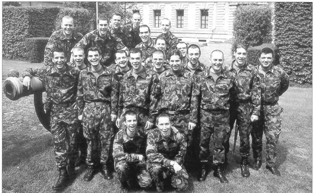
Zwei Qm Aspiranten aus der italienischen Schweiz und 19 aus der deutschen Schweiz absolvierten erfolgreich die Logistik-Offiziersschule 1/2002 in Bern.

Chères lectrices et chers lecteurs de ARMEE-LOGISTIK / LOGISTIQUE DE L'ARMÉE, je vous souhaite bonne lecture de la présente édition et des éditions à venir.