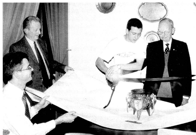
Bris de la marmite par les plus ancien et jeune membres de la soirée.

13 18.30 Denges rte de Préverenges 10: Initiation au Karting (Karting Formule Kart) 13 18.00 Café Le Grütli Lausanne: Match aux cartes 24 dès 15.00 activités spéciales: Chézard-St-Martin, 105 e Rencontre de quilles VD-GE-NE