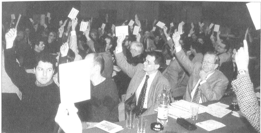
Einstimmig entschliessen sich die 69 Stimmberechtigten für den Verkauf von «Foursoft» an die Gruppe Rüstung im VBS.