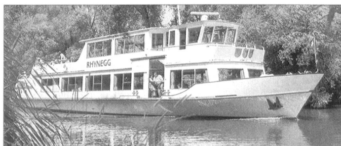
Das Motorschiff «Rhynegg» beherbergt uns im Anschluss an die dies-jährige Generalversammlung.