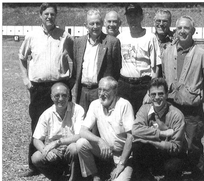
Groupe Genève an Tir Fédéral Bière

L'Assemblée ASF: samedi 12 mai 2001 à Lausanne au Musée Olympique