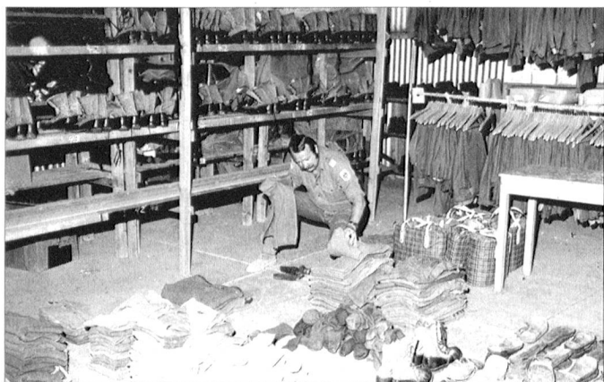
Höhere Ansprüche der Soldaten und schlechtere Voraussetzungen für die Bekleidungsverwaltung sind eine Geissel der Bekleidungsunteroffiziere.

«Stiefkind» war die einzige Branch, die für die humanitären und privatwirtschaftlichen Bedürfnisse der Einheimischen zuständig und auch tätig ist, nämlich die