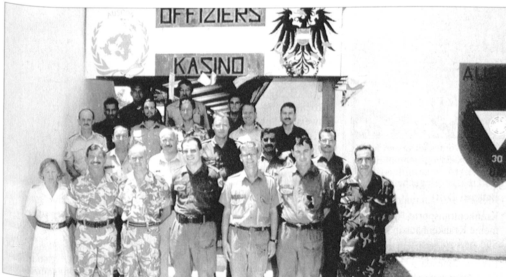
Alle zwei bis drei Monate wurde in einem der Bataillone eine »Logistics Conference« abgehalten, wo sich die wichtigsten Personal- und Versorgungsoffiziere der Force trafen.