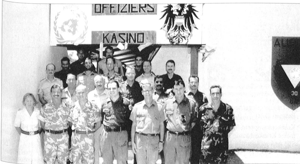
Alle zwei bis drei Monate wurde in einem der Bataillone eine «Logistics Conference» abgehalten, wo sich die wichtigsten Personal- und Versorgungs-offiziere der Force trafen.