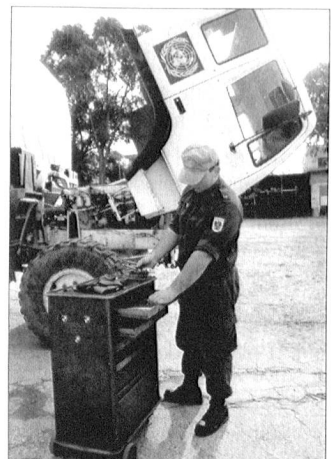
Die Instandsetzung unter erschwerten Bedingungen: die logistische Infrastruktur ist bei Auslandseinsätzen meistens unzureichend.

Für beide Branches existierte je ein Band eines englischen Handbuchs, der Standing Operational Procedures (SOP), als Aufgabenbeschreibung und Leitfaden.