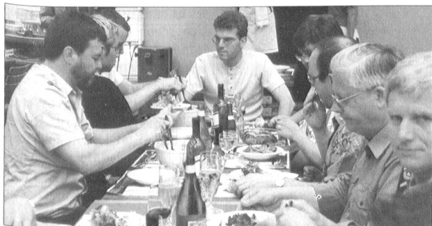
Risottoplausch in Ponte Brolla.