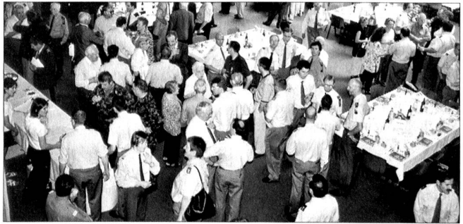
Aperitivo all'Espocentro di Bellinzona.

I quadri professionali e di milizia non acquisiscono la conoscenza della guerra attraverso trattazioni teoriche, né soprattutto attraverso lo studio di casi tratti dalla storia della guerra e la descrizione di casi concreti. La storia della guerra e la storia militare sono rimaste le raccolte più importanti della Biblioteca Militare. Soltanto chi si è confrontato con le esigenze estreme poste ai soldati durante la guerra e chi è