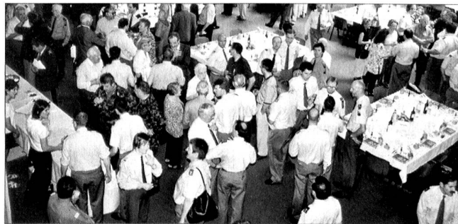
Aperitivo all'Espocentro di Bellinzona.

I quadri professionali e di milizia non acquisiscono la conoscenza della guerra attraverso trattazioni teoriche, bensì soprattutto attraverso lo studio di casi tratti dalla storia della guerra e la descrizione di casi concreti. La storia della guerra e la storia militare sono rimaste le raccolte più importanti della Biblioteca Militare. Soltanto chi si è confrontato con le esigenze estreme poste ai soldati durante la guerra e chi è