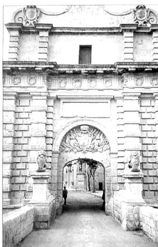
Ein Durchgang in der Stadt Mdina, eine Stadt wie im Märchenbuch.

Die Kathedralen und Kirchen sind im katholischen Malta mit den Schwesterinseln Gozo und Comino nicht wegzudenken. So sind denn auch für die Malteser «3 F» lebenswichtig (Festa, Fahnen, Feuerwerk). Alle Besucher sind jeweils gefesselt vom Anblick des Bodens der St. Johns Co-Cathedral in Valletta. 375 Grabplatten aufs kunstvollste mit Intarsienarbeiten in allen erdenklichen Farben des Marmors verziert, sind wie eine Gemäldegalerie im Boden eingelassen. Übrigens: Immerhin verfügen die Malteser über 365 Kirchen – für jeden Tag des Jahres ein Gotteshaus.