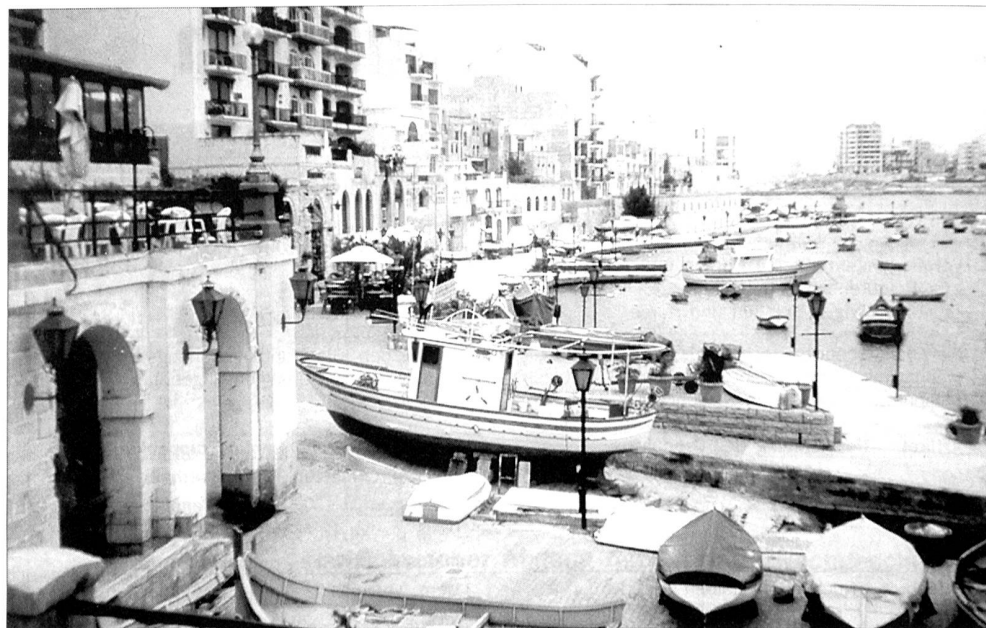
Gelassenheit und Ruhe sind besonders typisch für die Inselwelt Maltas. Sie stand von 1800 bis 1964 unter britischer Herrschaft und ist erst seit 1979 frei von britischen Truppen.

... liefen vier Konvois ohne Verluste in den Hafen Maltas ein. Allein in diesem Monat wurden an die 200 000 Tonnen Güter aller Art an Land gebracht. Doch dauerte es lange, bis die durch Mangel an Nahrung und Wohnmöglichkeiten geschwächten Menschen allgemein wieder zu Kräften kamen. Die Auswirkungen der Unterernährung und die damit einhergehenden Krankheiten wurden weiter durch eine schwere Poliomyelitis-Epidemie im November 1942 verschärft, die erst Anfang Juni des folgenden Jahres ihr Ende nahm.