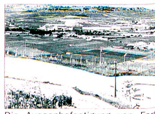
Die Aussenbefestigung von Fort Mosta.