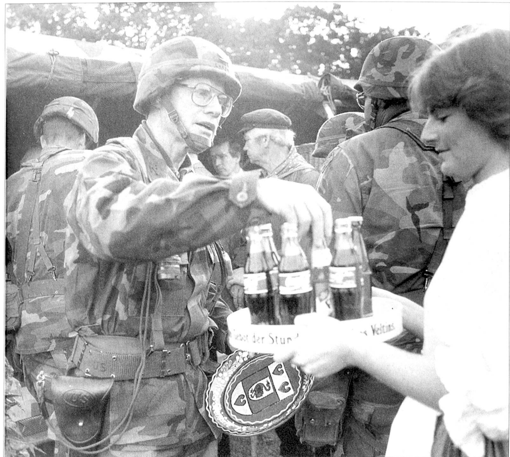
Reforgertruppen werden in Deutschland mit dem US-Nationalgetränk Coca-Cola versorgt.

Seither sind viele Jahre vergangen. Auch bei der US Army hat sich manches geändert, verbessert und verschlechtert. Die C-Rationen sind längst Geschichte und heute herrschen diese schweren, nahrhaften, aber wenig schmackhaften MRE-Mahlzeiten vor. In braunem Plastik sind die getrockneten Mahlzeiten wie Hafergrütze, Fertigmüsli, Stärke und verschiedensten Pulverchen verstaut. Der wenig schmackhafte Inhalt hat zwar einen hohen Brennwert von über 3000 Kalorien, wird aber von den Soldaten oftmals verschmäht. Sie werfen die Nahrungsmittel teilweise weg oder verschenken sie bei Manövern an