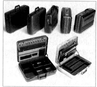
Der Allzweckkoffer von Prevent.

Wenn vorhanden, mit grünem Salat servieren. Auch Salzkartoffeln eignen sich als Zugabe.