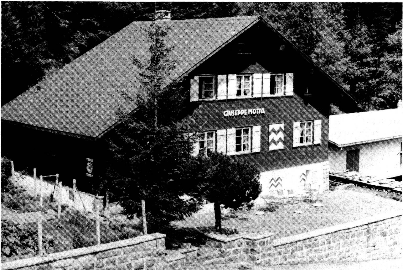
Soldatenhaus CVJM Airolo