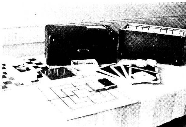
Spielsortimente in Pendelkoffer

Die Militärkommission der CVJM ist ein rechtlich selbständiges Arbeitsgebiet des CVJM/F-Bundes. Als Stiftung untersteht sie dem EMD, mit dem sie auch besonders viele Kontakte pflegt. Ihre Mitglieder sind Leute aus verschiedenen Landesgegenden und bekleiden unterschiedliche militärische Grade. Die Militärkommission der CVJM ist in ihren Diensten ökumenisch ausgerichtet, aber auch in ihrem Mitgliederbestand ökumenisch geprägt. Der finanzielle Aufwand der Kommission wird gedeckt durch