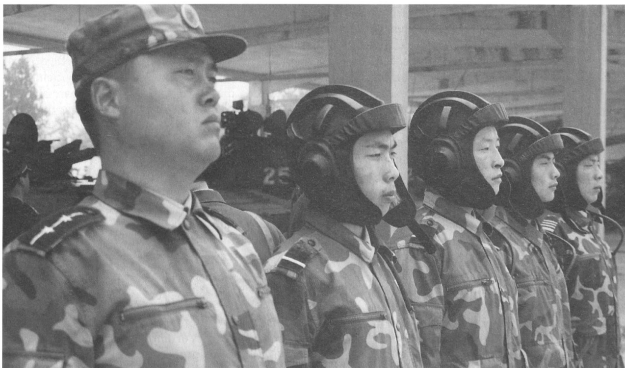
Der Kp Kdt, zusammen mit der Besatzung eines Kampfpanzers am Ende einer kurzen Gefechtsübung..