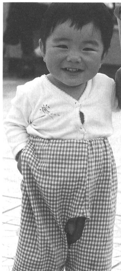
Ein kleiner Chinese, wie er im Buche steht. Die Kinder tragen keine Windeln, die Hosen haben alle einen grossen Schlitz.