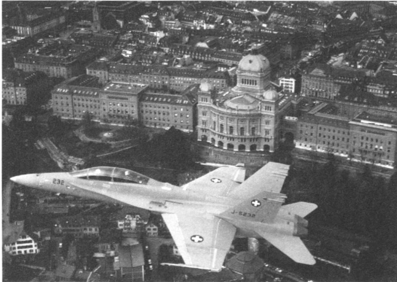
Einige Sujet-Beispiele aus der Postkarten-Serie