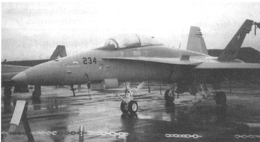
Das diesjährige Jahresprogramm der Sektion Zentralschweiz des Schweizerischen Fourierverbandes sieht auch eine Besichtigung der Flugzeugwerke und des F/A-18-Flugzeuges in Emmen vor.

Der Mitgliederschwund, die abgebliebenen Anlässe im auslaufenden Tätigkeitsprogramm.