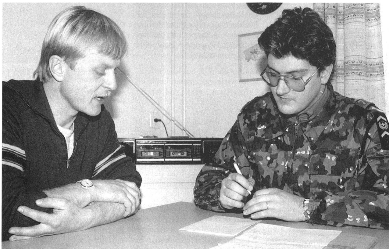
Der Fourier ist der direkte Ansprechpartner zwischen der Zivilbevölkerung und der Armee.