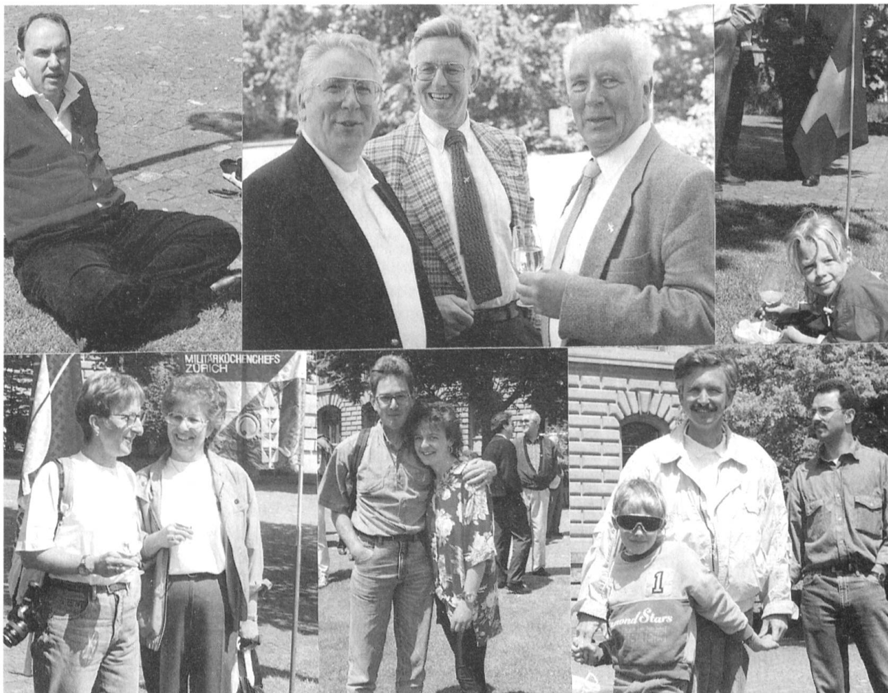
Die Kundgebung vom 22. Mai 1993 in Bern geht in die Geschichte des Schweizerischen Fourierverbandes ein. 200 Hellgrüne mit Anhang folgten dem Aufruf, an der machtvollen Demonstration gegen die beiden Armee-Abschaffungs-Initiativen teilzunehmen. Für die meisten Küchenchefs, Fouriere, Quartiermeister und die anderen Anwesenden war es die erste Kundgebung im Leben, an der sie sich beteiligten.