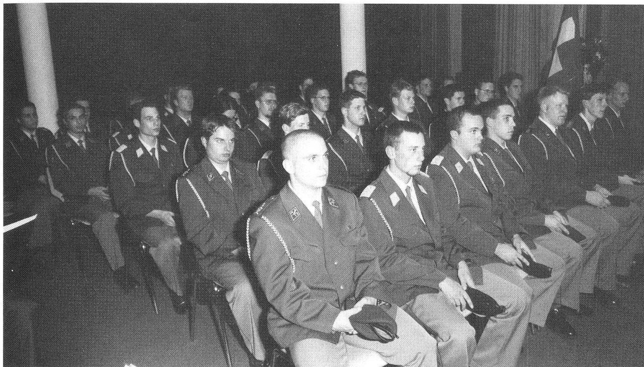
35 Unteroffiziere aller Waffengattungen wurden im Stadttheater Langenthal zu Fourieren befördert.