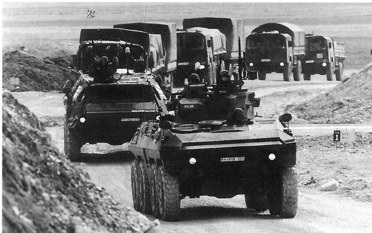
Soldaten des Transportbataillons GECONIFOR (L) fahren in einem gesicherten Konvoi Ersatzteile sowie Einzel- und Mengenverbrauchsgüter von Split über Kamensko (Grenze zwischen Kroatien und der Moslemisch-Kroatischen Föderation), Duvno, Kupres (Britischer Versorgungspunkt) nach Siporo (Britischer Versorgungspunkt). Im Bild: Der Konvoi auf der noch nicht fertiggestellten Umgehungsstrasse von Tomislavgrad.

In zahlreichen Versorgungskonvois wurde eine grosse Anzahl von Versorgungspunkten angefahren und zum Teil unter recht schwierigen klimatischen Verhältnissen mit Betriebsstoffen und weiterer Fracht beliefert. Sämtliche Konvois werden von Kampftruppen der Bundeswehr selbst gesichert. An der Spitze fahren jeweils ein gepanzertes Fahrzeug LUCHS und FUCHS, ihnen folgt im Abstand von 500 Meter der Transportführer in einem weiteren FUCHS. Nun folgen die