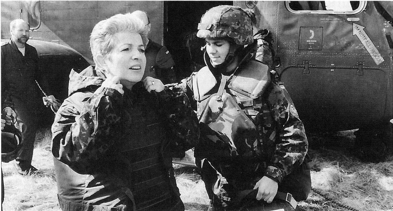
Die Wehrbeauftragte des Deutschen Bundestages, Claire Marienfeld, besucht Soldaten des deutschen IFOR-Kontingentes. Die Soldaten des Pionierbataillon GECONIFOR (L) reparieren die schwer beschädigte Brücke über die Bosna bei der Ortschaft Visoko, welche rund 20 km nordwestlich von Sarajewo liegt. Im Bild: Stabsunteroffizier Silvija Paleka hilft der Wehrbeauftragten in die Schutzweste.