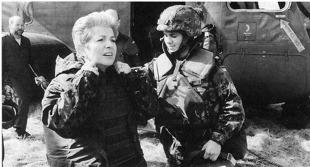
Die Wehrbeauftragte des Deutschen Bundestages, Claire Marienfeld, besucht Soldaten des deutschen IFOR-Kontingentes. Die Soldaten des Pionierbataillon GECONIFOR (L) reparieren die schwer beschädigte Brücke über die Bosna bei der Ortschaft Visoko, welche rund 20 km nordwestlich von Sarajewo liegt. Im Bild: Stabsunteroffizier Silvija Paleka hilft der Wehrbeauftragten in die Schutzweste.