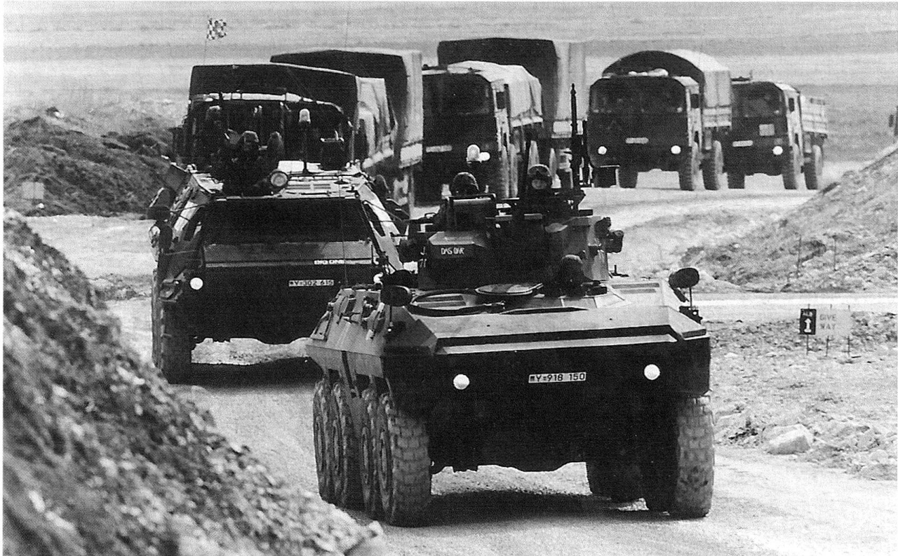
Soldaten des Transportbataillons GECONIFOR (L) fahren in einem gesicherten Konvoi Ersatzteile sowie Einzel- und Mengenverbrauchsgüter von Split über Kamensko (Grenze zwischen Kroatien und der Moslemisch-Kroatischen Föderation), Duvno, Kupres (Britischer Versorgungspunkt) nach Siporo (Britischer Versorgungspunkt). Im Bild: Der Konvoi auf der noch nicht fertiggestellten Umgehungsstrasse von Tomislavgrad.

In zahlreichen Versorgungskonvois wurde eine grosse Anzahl von Versorgungspunkten angefahren und zum Teil unter recht schwierigen klimatischen Verhältnissen mit Betriebsstoffen und weiterer Fracht beliefert. Sämtliche Konvois werden von Kampftruppen der Bundeswehr selbst gesichert. An der Spitze fahren jeweils ein gepanzertes Fahrzeug LUCHS und FUCHS, ihnen folgt im Abstand von 500 Meter der Transportführer in einem weiteren FUCHS. Nun folgen die