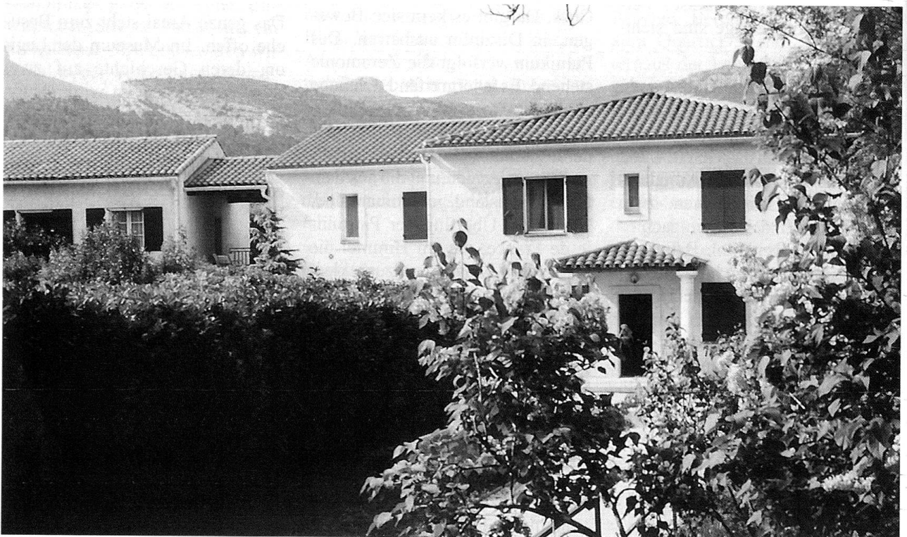
«Maison du Légionnaire» in Auriol. Eines der verschiedenen Pavillons.

Wehmütig denke ich eigentlich an das Erlebte zurück: Die Legionäre haben ihr Daheim, ihre Heimat in der Legion gefunden. Sie werden niemals im Stich gelassen. Die Legion sorgt für ihre Angehörigen und kümmert sich besonders um die Verletzten und Veteranen. In Frankreich haben sie ihre Institutionen, in der ganzen Welt ihre Amicales, ihre Ehemaligen-Vereine.