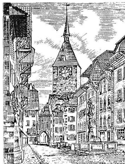
Die Rathausgasse in Aarau anno 1900.