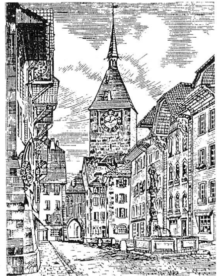
Die Rathausgasse in Aarau anno 1900.