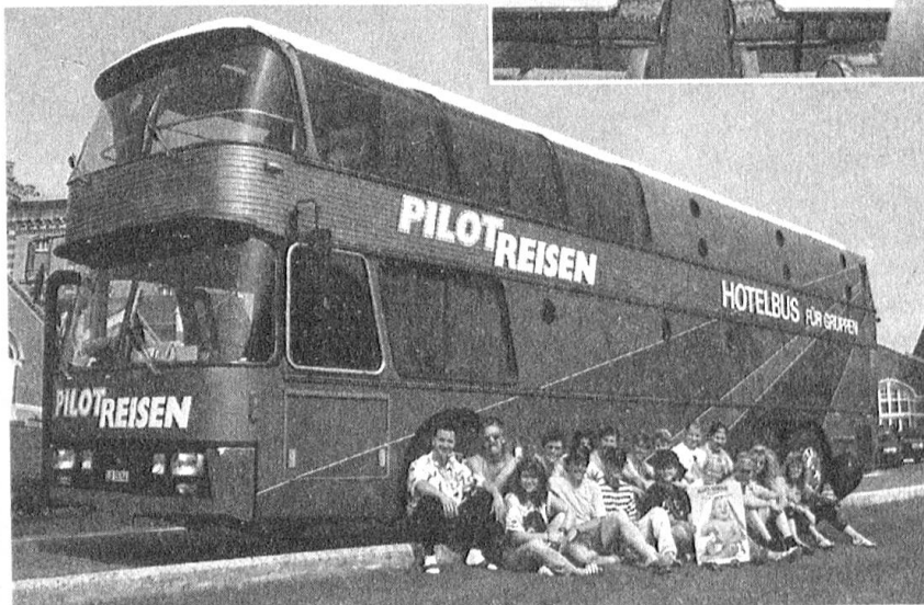
Die bequeme Art zu reisen...natürlich im Schlafbus von «PilotReisen».