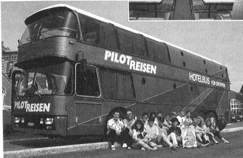
Die bequeme Art zu reisen... natürlich im Schlafbus von «PilotReisen».