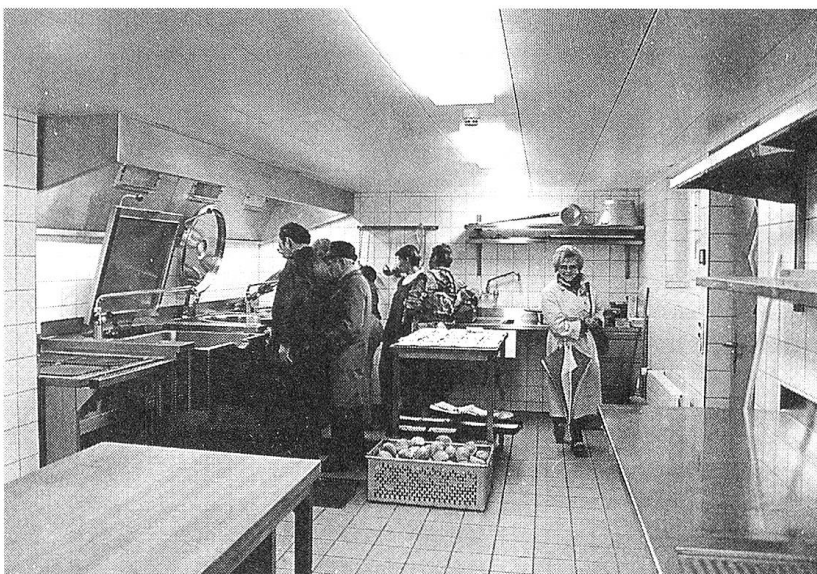
Unser Bild zeigt einen Blick in die sanierte und erweiterte Küche.

Alterserscheinungen führten in den letzten Jahren zu Sanierungsstudien und schliesslich am 10. April 1991 zur Bewilligung eines Baukredites von über 3 Millionen Franken durch die Gemeindeversammlung. Nach Abschluss aller Sanierungs- und Erweiterungsarbeiten wurde das vortrefflich gelungene Werk am 3. April 1993 der Bevölkerung an einem «Tag der offenen Türen» vorgestellt. Das neue Konzept ermöglicht die Nutzung ziviler Teile auch bei militärischer Belegung; eine Neuzufahrt für die Truppe berücksichtigt berechnete Anliegen der Nachbarn.