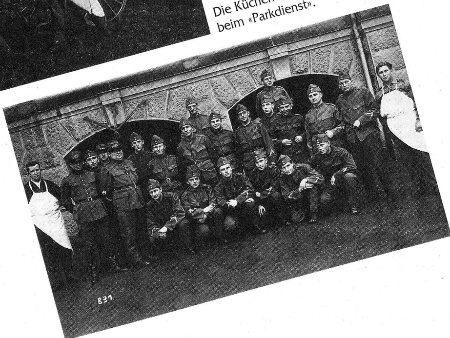
Die Absolventen der Fourierschule IV/1931 in der Kaserne Thun.