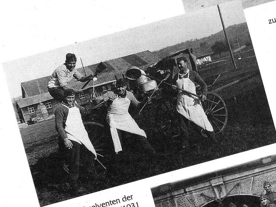
Die Absolventen der Fourierschule IV/1931 in der Kaserne Thun.