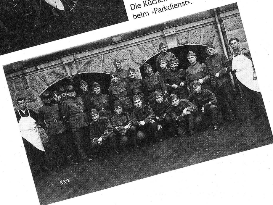
Die Küchen-Mannschaft beim «Parkdienst».