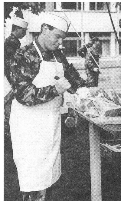
Die Kursteilnehmer werden beim Zentralen Kurs für Ausbildungsleiter im Küchendienst (ZAK) nicht nur informiert, sie erarbeiten ebenso unter Anleitung der Fach-Instruktoren ihre entsprechenden Ausbildungsunterlagen.

Als Ausbildung an den Dampfdruckapparaten bereitet jede Klasse ihre eigene Mahlzeit zu, und zwar: Berner Erbsensuppe, Freiburger Schafsvoressen, Schnittlauchkartoffeln und Karamelköpfl.