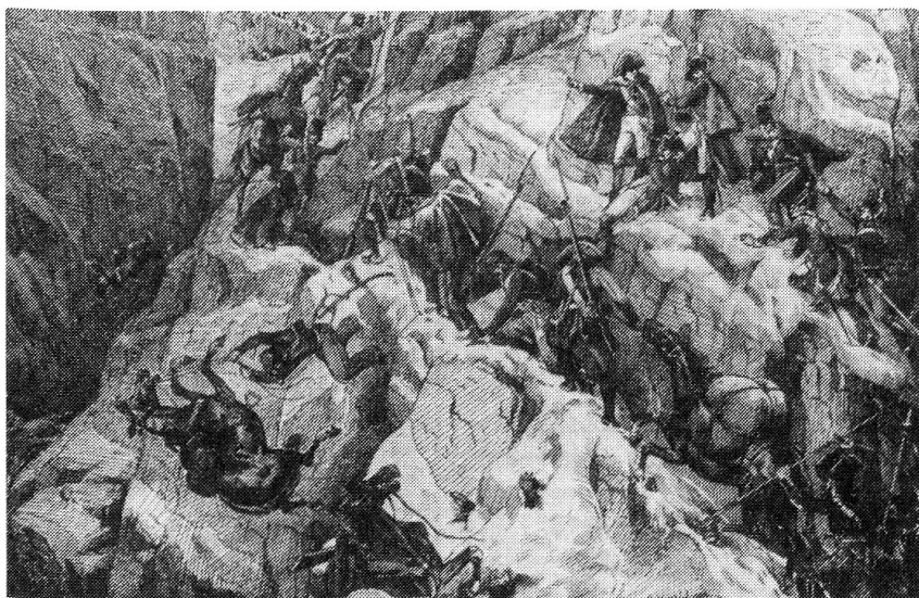
Müde und vom Hunger geplagt, überqueren die Russen den Panixerpass

Der österreichische Stabschef, den Suworow in seiner Armee beschäftigte, Oberst Weyrother, verlangte, dass ab Bellinzona für die Operation mit einer siebentägigen Dotation begonnen werden sollte. Dies bedeutete, dass man mit einer ausreichenden Verpflegung nur rechnen konnte, wenn die ganze Armee die schwer passierbaren Gebirgsketten innerhalb von sieben Tagen zurücklegte. Dies war jedoch selbst ohne feindliche Behinderung nur schwer möglich. Nicht besonders glücklich gewählt waren zudem auch die beiden De-