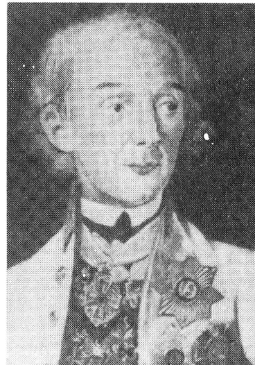
Unser Bild zeigt General Suworow.

jeden einzelnen Soldaten möglichst hoch gehalten werden. Dem Angriffsplan wurde auch ein Verpflegungsplan beigegeben. Dieser sah vor, dass der einzelne Soldat eine Verpflegungsration von drei Tagen auf sich trug und dass weitere Verpflegung für drei Tage auf den Maultieren nachgeführt wurde. Noch in Asti glaubte man, von Bellinzona aus am 21. September abmarschieren zu können, um Schwyz am 26. zu erreichen. Bei Einhaltung dieses Planes hätte man für die Etappe bis Schwyz eine Ration mehr als gerade notwendig mitgeführt. In Schwyz angekommen, war man der Meinung, durch Vermittlung der Generale Hotze und Korsakow Lebensmittel