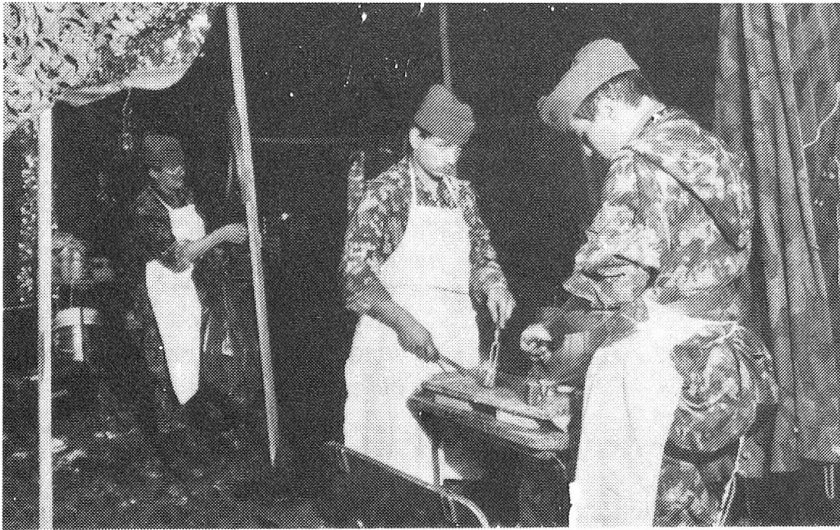
Sitten hat sich für die artilleristische Ausbildung einen Namen gemacht. Hier die Felddienstküche bei der Arbeit.

sonen sich weit verbreitet haben. Es bringt die Überzeugung, wie die Gebote, die Formen und Bräuche, ohne die keine Gesellschaft bestehen kann, das Wertbewusstsein prägen können.