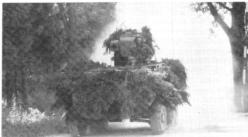
Anlass zu diesem Besuch in Österreich gab der Panzerjäger Piranha, ausgerüstet mit TOW 2. Im Bild: Ein Schweizer Piranha in voller Fahrt auf einer Landstrasse im Bereich des Truppenübungsplatzes Allentsteig.