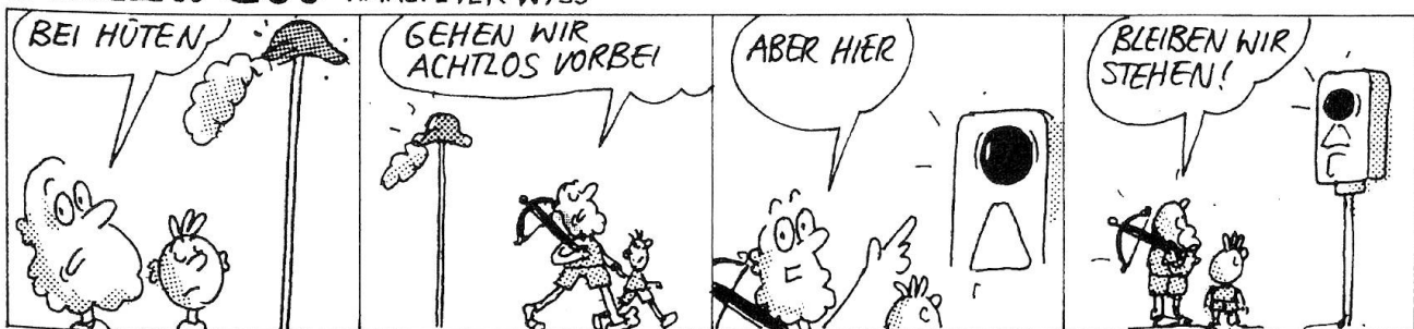
Schweizerische Beratungsstelle für Unfallverhütung bfu